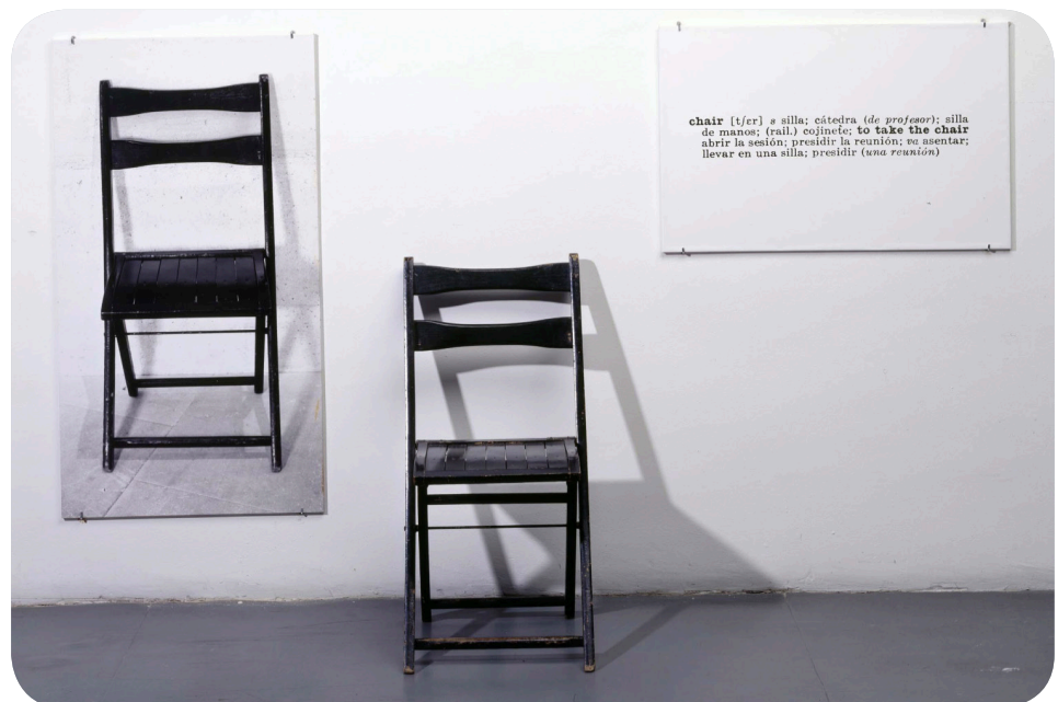
"One and three chairs" de Joseph Kosuth.