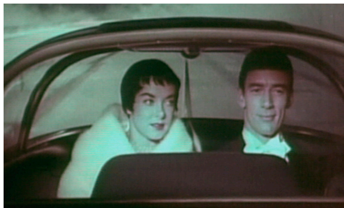
The Power of Nightmares. Episode 3: The Shadows in the Cave (2004)

La serie se divide en tres capítulos. El primero, Baby It's Cold Outside , trata las raíces comunes de las ideologías polarizadas que rigen Afganistán y Estados Unidos a comienzos del siglo XXI y narra los orígenes de dos grupos de pensamiento: los neoconservadores y los radicales islamistas, ambos nacidos de la crisis de la democracia liberal. Al primer grupo pertenece el filósofo y politólogo Leo Strauss (1899-1973), quien considerará que el neoliberalismo e individualismo occidentales conducen al nihilismo y que la política debe repensarse como un espacio para crear mitos.