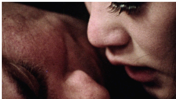
It Felt Like a Kiss (2009)

En este sentido, Adam Curtis construye la historia de las células inmortales de Henrietta Lacks en sucesivas capas. Se trata de una historia racial de clase, en el que el reconocimiento real de la mujer negra y obrera que dota a la ciencia de la primera cadena celular humana no se producirá hasta décadas después de su muerte. Se trata de la historia de la investigación sobre el cáncer y su construcción somática y médica, transitando desde virus externo a epidemia colectiva. Y, en último término, se trata de una historia de poder durante la Guerra Fría, en el que las dos potencias dominantes, el bloque soviético y el norteamericano, competirán en la carrera biológico-científica, una historia menos conocida que las llamadas carreras espaciales o armamentísticas. The Way of All Flesh es capaz de transitar de la biografía emocional a la construcción social y pública de la enfermedad contemporánea. A comienzos de 1970, impulsado por la presión de la opinión de clase acomodada, el cáncer entrará de lleno en la agenda política. Un año después, Nixon declarará la "guerra contra el cáncer". En 1972, Rusia declarará haber aislado el virus del cáncer para comprobar que todas las muestras estaban contaminadas por la cadena biológica de HeLa y, por tanto, sometidas a conclusiones e investigaciones erróneas. Tras el estatismo en la investigación de la década de 1970, la teoría del virus se abandonará por la de la determinación genética. Esta tesis